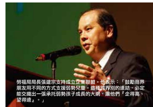
勞福局局長張建宗支持成立企業聯盟。他表示：「鼓勵商界朋友用不同的方式支援弱勢兒童。這種跨界別的連結，必定能交織出一張承托弱勢孩子成長的大網，讓他們『企得高，望得遠』。」