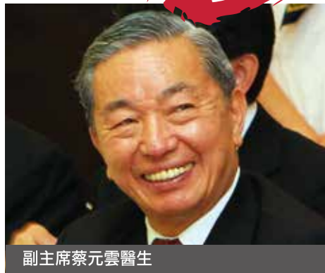
副主席蔡元雲醫生